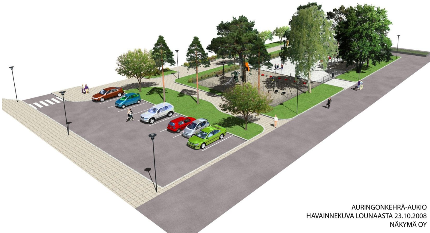
AURINGONKEHRÄ-AUKIO HAVAINNEKUVA LOUNAASTA 23.10.2008 NÄKYMÄ OY